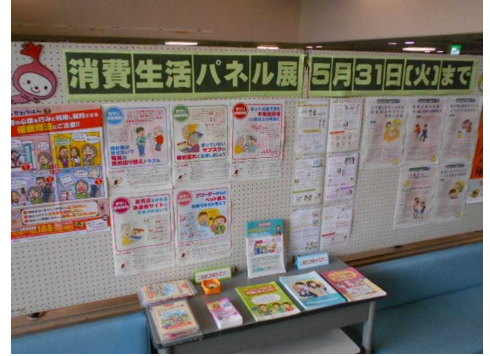
消費生活パネル展

5月は消費者月間です。 契約等の消費者トラブルに巻き込まれないよう知識を身につけましょう。 ロビーでのパネル展、DVD 放映等も同時開催いたします。 関連する図書をご用意しましたので、お立ち寄りください。