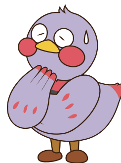
埼玉県マスコット「さいたまっち」