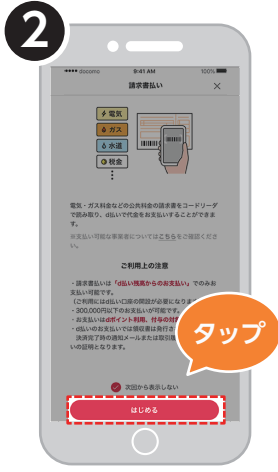
2 請求書支払いの説明を確認し、「はじめる」をタップ