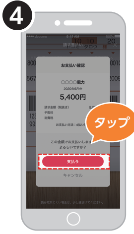
4 決済内容を確認し、「支払う」をタップ