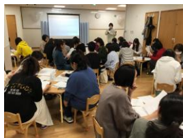
ひろさわ保育園 園内研修の様子