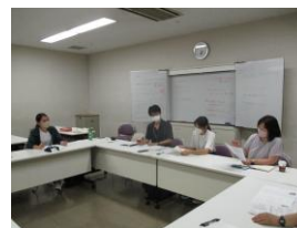
事例検討会の様子