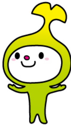
和光市イメージキャラクター わこうっち