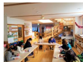
里仁育舎 園内研修の様子

上記に挙げたのは、市内保育施設で実施されている取組みの一例です。有効な園内研修の実施方法や会議の持ち方など、保育士等に求められる資質の維持や向上のために自園でできる取組みについて考えてみましょう。