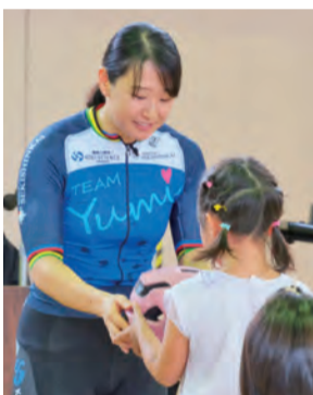
自転車用ヘルメット寄贈式

6月の世界自転車デーに合わせて、また昨年4月から自転車用ヘルメットの着用努力義務の法律が施行されたことを受け、着用の意識づけを目的に昨年6月2日に母校