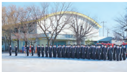
人員服装規律点検