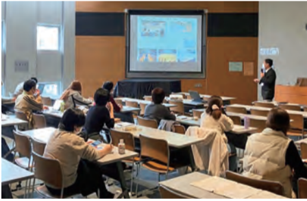
▲危機管理監による講義の受講の様子 危機管理監より、和光市の防災対策について、講義いただきました。実体験を交えて講義いただき、参加者も真剣な様子で受講していました。

下記のほかにも、有識者を招いた講義を開催したり、青少年育成和光市民会議主催事業に協力しています。