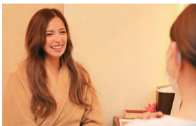
▲全てのお悩みに寄り添えるよう些細なことで相 談しやすいカウンセリング