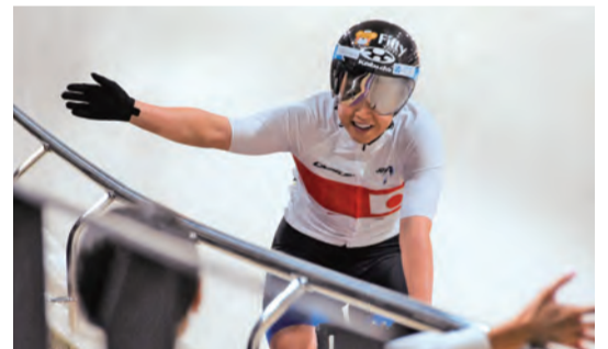
ファンとのハイタッチ！

市長 新型コロナウイルス感染症の位置付けが5類となり、今年はコロナ前と同じように走っていくこととなりますが、同時にコロナ禍を通して見えてきた不必要なことの整理もしていかなければいけないと感じています。そして、駅北口の再開発を始めとしたハード面の整備とともに、つながりづくりのソフト面の充実も進めていき、市民の皆さんと一緒に和光市を盛り上げていきたいと思っています。