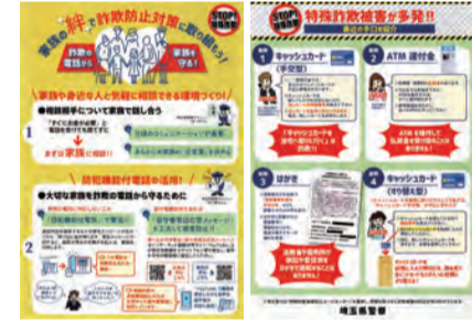
▲特殊詐欺被害防止啓発資料 朝霞警察署生活安全課の担当の方より、朝霞警察署管内等の犯罪認知件数の状況、特殊詐欺などの防犯対策について、講義いただきました。防犯意識の向上につながる貴重なお話を聴かせていただきました。