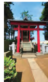
豊川稲荷神社のお稲荷様

隣接する「南市場ふれあいの森」は、白子三丁目土地区画整理事業作業中とのこと。完成すれば、さらに地域の人の憩いの場所が広がることでしょうか。お近くにお越しの折にはどうぞ一度、お立ち寄りください。