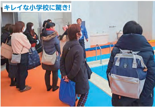
下新倉小学校を視察し、現地では担当の先生に校内を案内していただきました!