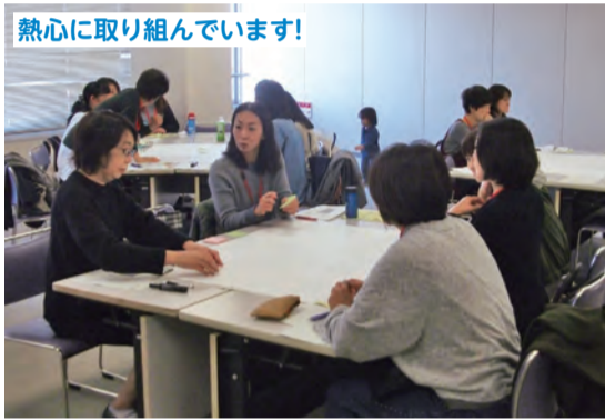
青少年育成推進員同士でワークショップを行い、市内各地域の情報を共有しました!