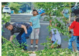
▲クリーン・オブ・和光の様子