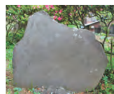
▲白子熊野神社富士塚の石造物

これらの拓本や調査の成果をまとめた報告書「和光市の富士塚」は、市内図書館、各公民館図書室・白子コミュニティセンターで閲覧することができますので、ぜひご覧ください。