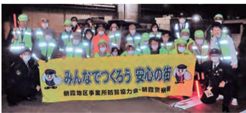
自治会連合会市内一斉防犯パトロール(総合福祉会館にて)

また、住民から見られたり声を掛けられると「顔を覚えられた」という警戒心から、その地域での犯行を避ける傾向にあり、積極的なあいさつや声かけがとても有効です。