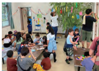
▲七夕会でのにぎわう集会所

現代では地域住民相互の関係が希薄になってきていると言われておりますが、転勤等で住人の入れ替わりが激しい和光官舎自治会だからこそ、"遠くの親戚より近くの他人"ということわざにもあるように、今後とも住人同士のつながりや、付き合いを継続していきけるような自治会活動を運営していきたいと思っております。