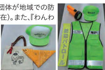
パトロールグッズ▶

市では、登録された自主防犯活動団体などにパトロールグッズを貸与し、「見せる防犯」を支援しています。