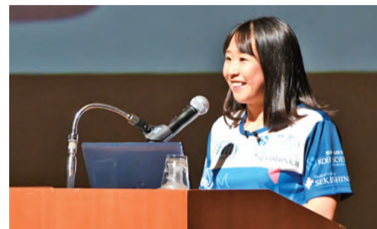
サンアゼリアで開催された講演会の様子

母の教育は小さいころから「見守る教育」でした。試合やトレーニングを見ても、母は「もっとこうしな」とか「こうした方が良かった