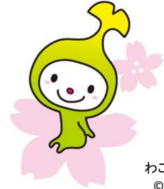
わこうっち

さて、今号では和光市駅北口土地区画整理事業と一体的に整備を行う市街地再開発事業を都市計画決定したことについてご報告いたします。