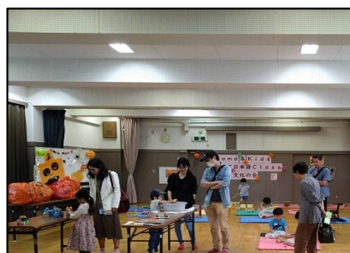
木育おもちゃの広場