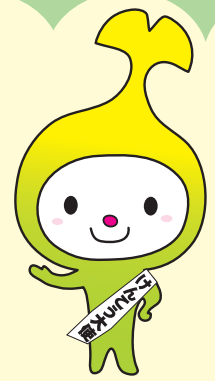
和光市イメージキャラクター「わこうっち」