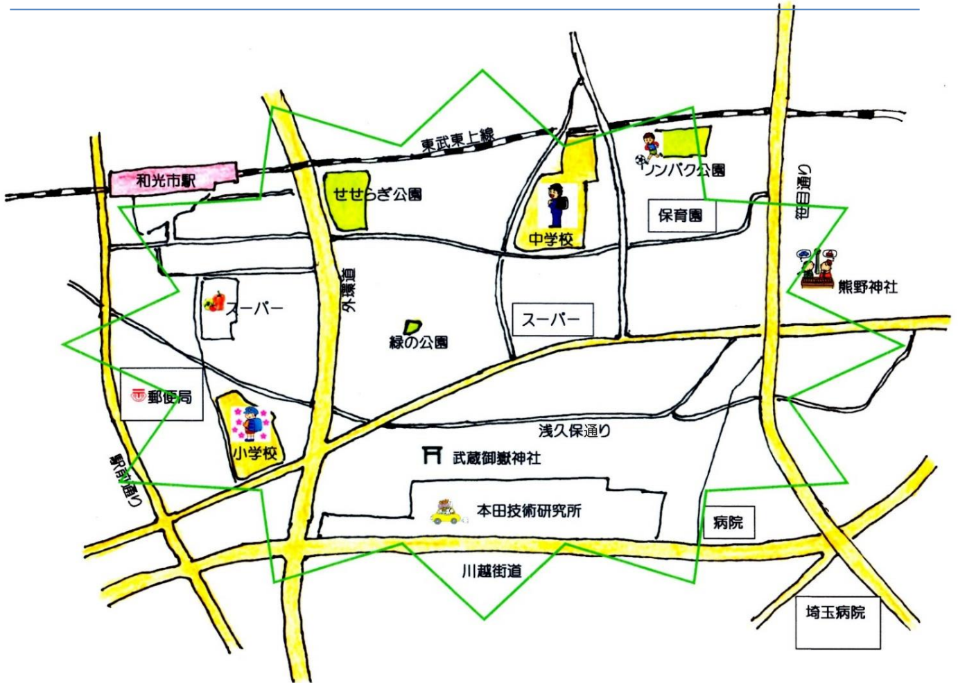
和光市の高齢者割合・年少者割合