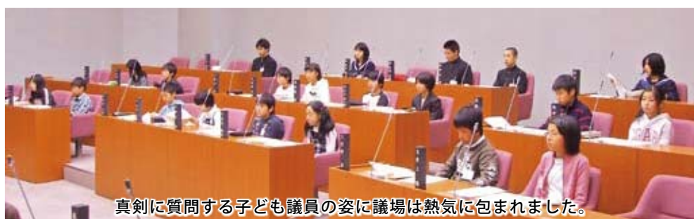
真剣に質問する子ども議員の姿に議場は熱気に包まれました。

当日、子ども議員は緊張した面持ちで、普段感じていること、市への要望等様々な質問や提案を行いました。 詳しくは、議会ホームページをご覧ください。