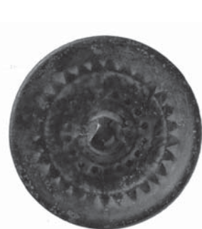
伝 午王山遺跡出土珠文鏡