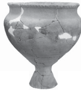
午王山遺跡出土弥生土器