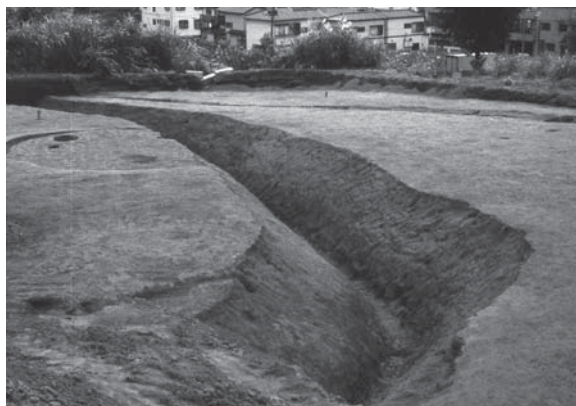
確認された住居と環濠