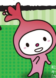
和光市 キャラクター 「がつみちゃん」