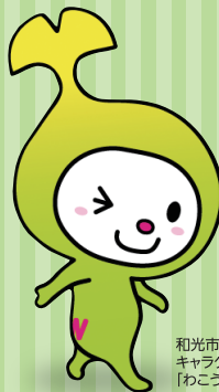
和光市イメージ キャラクター 「わこちゃん」