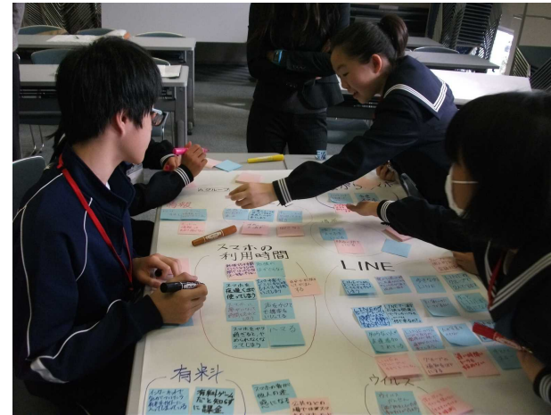
②課題に対する対応策の書き出し