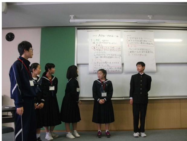
③対応策からグループごとにルール化