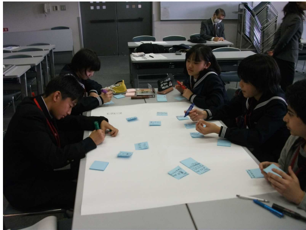
①課題の書き出し・グループ分け