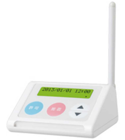
迷惑電話チェッカー

最近、特に 高齢者を中心に悪質・迷惑な電話勧誘による消費者被害が増加 しています。この状況に対し、これまでの取り組み（啓発・注意喚起）と異なるアプローチとして、下記の機能を持つ「迷惑電話チェッカー」を希望する市民に 無償で貸出し 、 電話勧誘による被害の防止 と併せて、この「 迷惑電話チェッカー 」の 効果の検証 を行います。