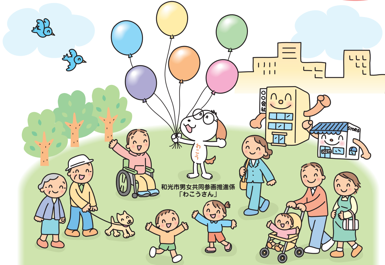
和光市男女共同参画推進係「わこうさん」

個人の尊重と法の下での平等をうたう日本国憲法のもとで、男女平等の実現に向けた取組は、「女子差別撤廃条約」を支柱とする国際的な取組とともに着実に進められてきました。