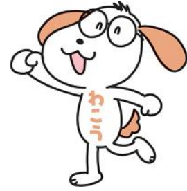
和光市男女共同参画推進係 わこうさん