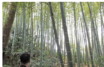
新倉ふれあいの森

市内に残る貴重な自然環境を保全し、市民の皆さんに利用してもらうために、土地所有者からお借りして公開しています。環境団体と協働で維持管理しており、環境学習や鑑賞会など、地域の自然を知り、触れ合う、重要な場となっています。