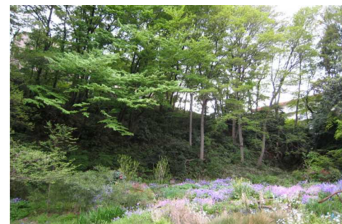
大坂ふれあいの森