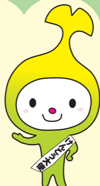
和光市イメージキャラクター「わこうっし」